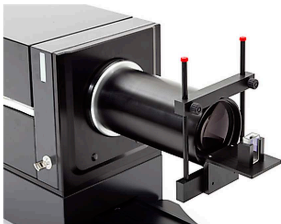
Мокрое измерение с использованием пакетной ячейки

Фиксирующие приспособления для поддержки различных типов распылителей