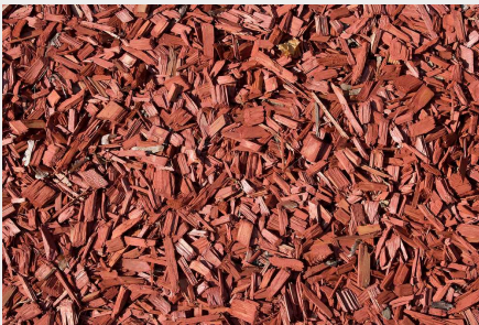
Copeaux de bois

Le pycnomètre BELPYCNO L convient pour l'analyse de la densité dans une large gamme d'applications : poudres, bois, Matériaux de construction, Catalyseurs, liquides et pâtes, Charbon actif, aliments, Produits pharmaceutiques, ... et plus encore!